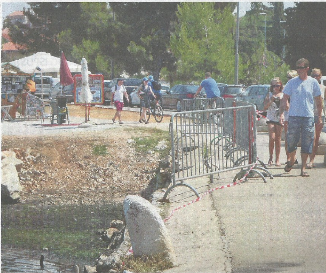
Željezna ograda od jučer se nalazi uz urušenu šetnicu na Peškeroi